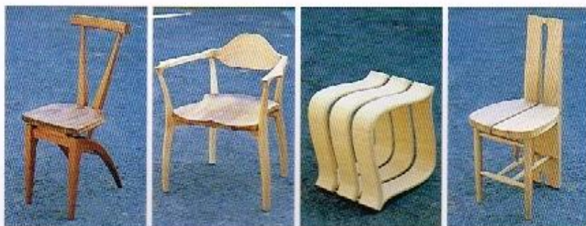
4 3 2 1

1) 小さな椅子 3万5000円。素材は楡。2) leaf stool 参考商品。成形合板。3) arm chair 5万円。楡。座面はブラックウォールナット。4) ss chair 3万8000円。チーク、ブラックウォールナット。どの製品も材料から選ぶことができ、価格は材料の種類によって変わる