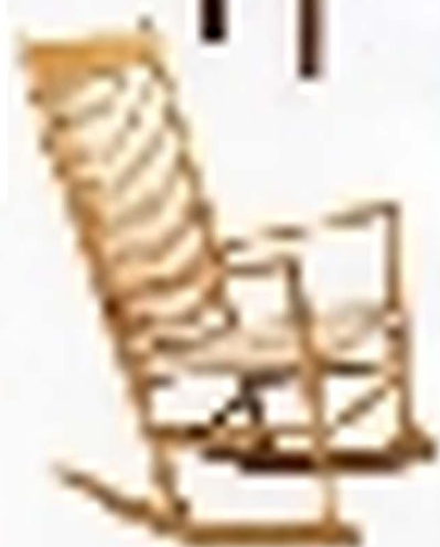
rocking chair rocking chairは、リラックスした姿勢で読書や作業ができる。自然な木目と優しい曲線が、心地よい空間を演出する。