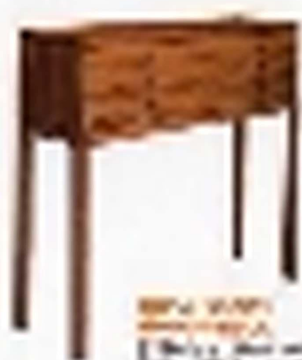
ダイニングテーブル ダイニングテーブルは、食事の時間だけでなく、読書や作業にも使える。シンプルで美しいデザインが、毎日の生活に彩りを添える。