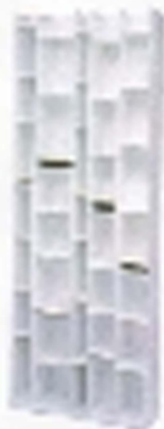
モジュールシェルフ モジュールシェルフは、壁に掛けたり、床に置いたり、自由に組み合わせることができる。部屋の雰囲気に合わせて、様々な使い方ができる。