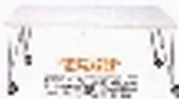
コーヒーテーブル コーヒーテーブルは、リビングの中心に据える。読書や作業にも使える。シンプルで美しいデザインが、毎日の生活に彩りを添える。